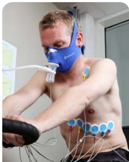
Testlaboratorium. Testing av VO 2 -maks og arbeids EKG.

Med avansert utstyr kan vi måle VO 2 -maks ml/min/kg (maksimal oksygenoptak) som er et mål for kondisjonen. Videre tilbys laktatprofil og utarbeidelse av individuelle treningszoner for optimal treningseffekt. Tilbudet benyttes både av mosjonister og aktive idrettsutøvere.