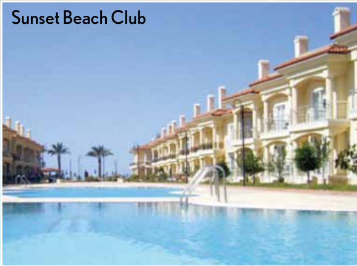
Sunset Beach Club