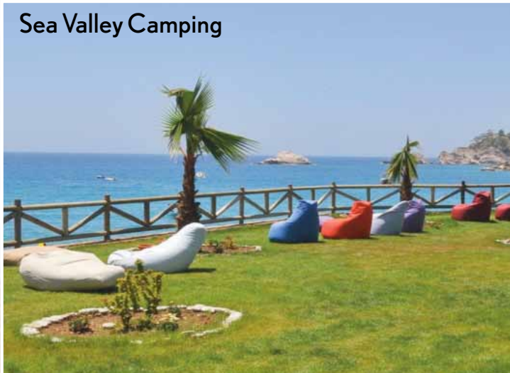
Sea Valley Camping